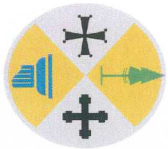
Tabella riepilogativa dei principali adempimenti in materia di trasparenza, anticorruzione e ciclo di gestione della performance - Regione Calabria ed enti strumentali sottoposti all'OIV della Giunta regionale in base all'art. 2, comma 2, legge regionale 3/2012 e all'art. 13, comma 8, l.r. 69/2012 1 (aggiornamento al 10 febbraio 2017)